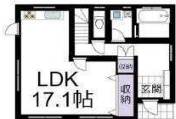
1階 52.25m 2

気になる間取りは?? 玄関ホール・2階ホールが広々 陽当たり良好で、各部屋明るい 庭に倉庫あり。自転車やバイク等 収納できます!